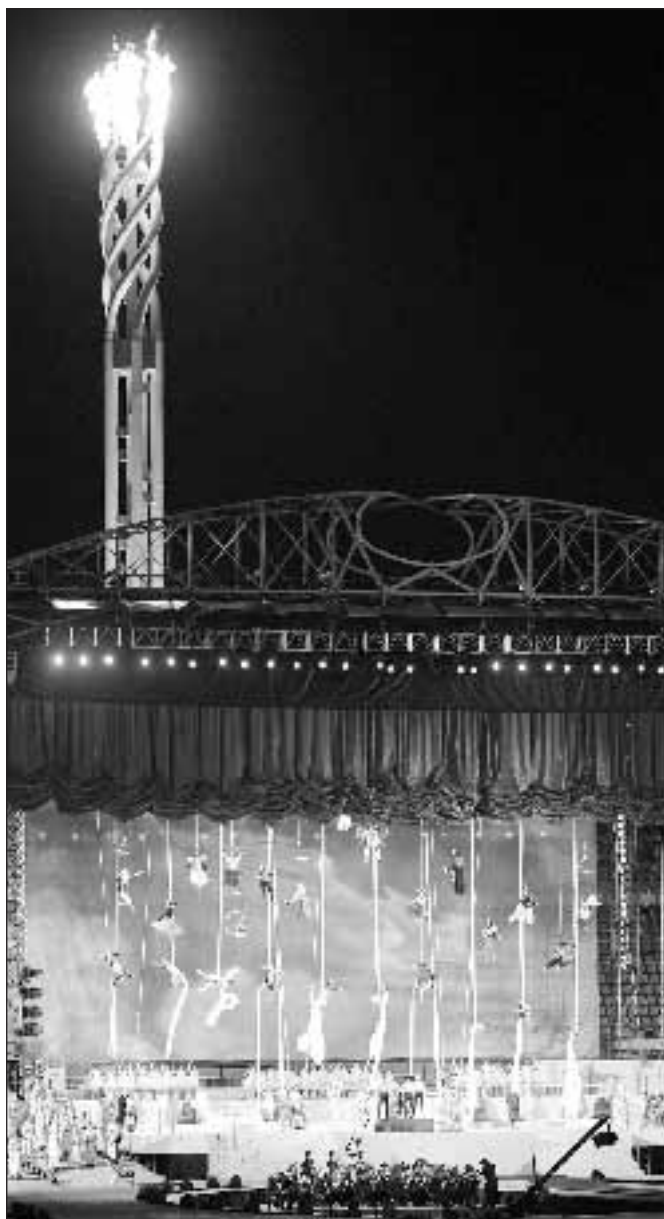
La cerimonia di chiusura delle Olimpiadi

passaggio di consegne ideale tra Torino e Vancouver, rappresentata nelle coreografie, alla presenza del sindaco della città canadese, visto che i prossimi giochi invernali sono previsti nella British Columbia nel 2010. Improvvisamente una ragazza nuda fa irruzione nel campo con uno striscione con scritto «Mi consenta»: viene bloccata e portata via dalle forze dell'ordine. È una serata particolare... Poi lo spettacolo, colorato e affascinante, ma il momento clou è quando sono passati venti minuti e le prime scene sono finite: allora c'è la premiazione dell'ultima gara dell'Olimpiade (esclusa la finale dell'hockey) la 50 km di fondo. Giorgio Di Centa riceve la medaglia d'oro. La tensione si scioglie in un lungo applauso.