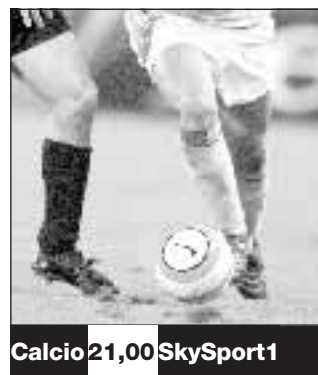
Calcio 21,00 SkySport1