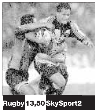
Rugby 13,50 SkySport2