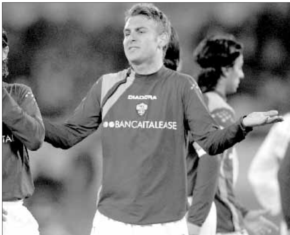
Daniele De Rossi al centro di un caso dopo aver ammesso di aver realizzato un gol con la mano