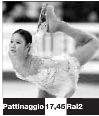
Pattinaggio 17,45 Rai2

Il francese Philippe Troussier, ex allenatore di Giappone e Marocco, si è convertito all'Islam. Residente da anni a Rabat, dove ha adottato due bambine marocchine, è stato recentemente esonerato dopo soli due mesi di lavoro. I tifosi erano con lui e Troussier ha restituito i compensi ricevuti