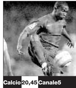
Calcio 20,45 Canale5