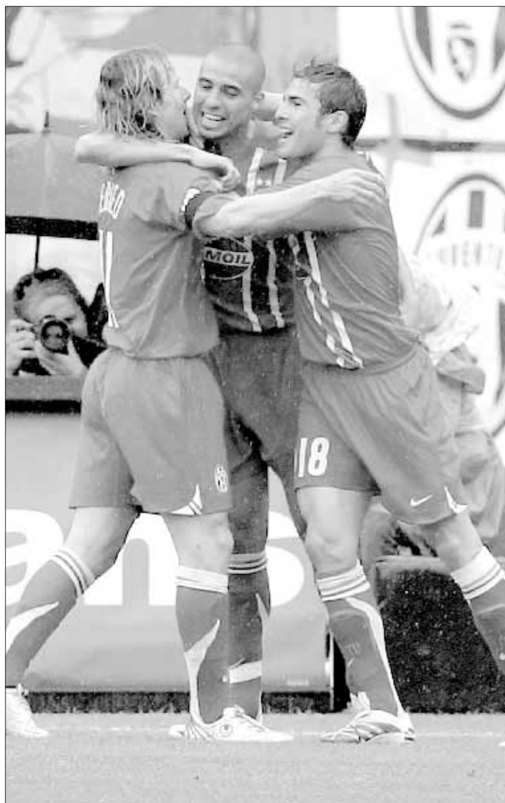
Trezeguet abbracciato da Nedved e Mutu dopo il gol.