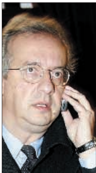
Gerina a pagina 9