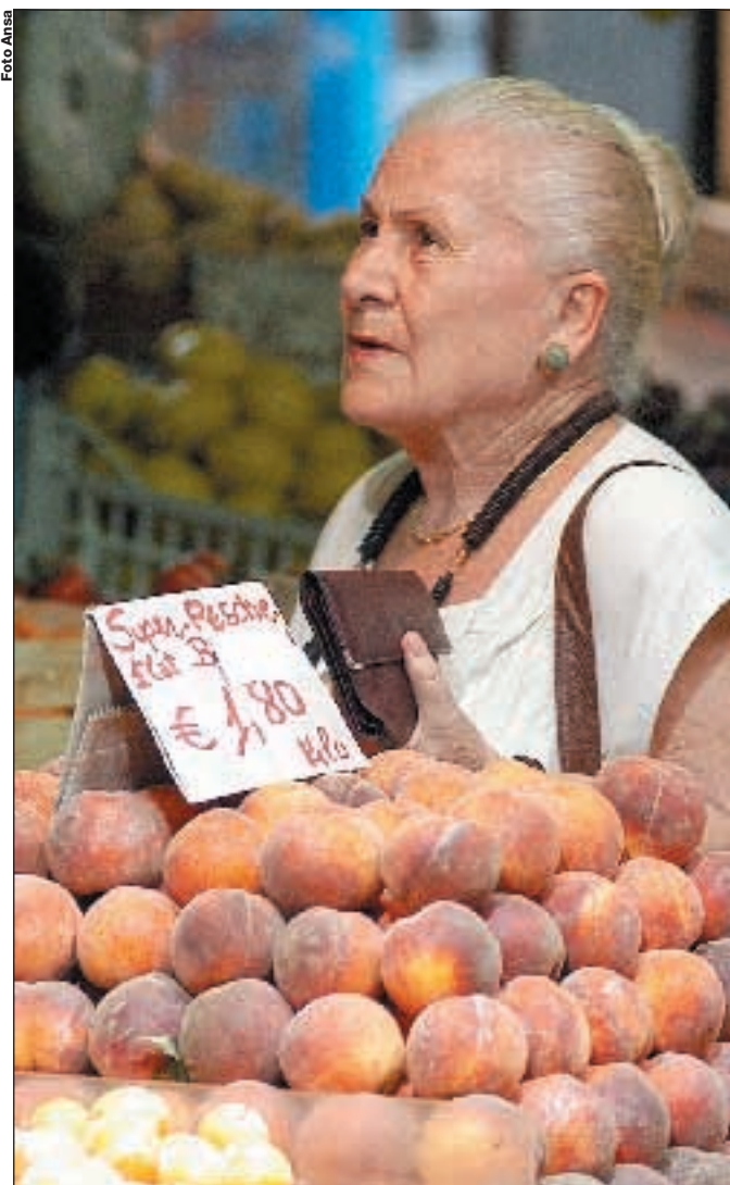
Di Giovanni e Venturilli a pagina 2

Ecco un altro disastro: l'Italia povera e ingiusta