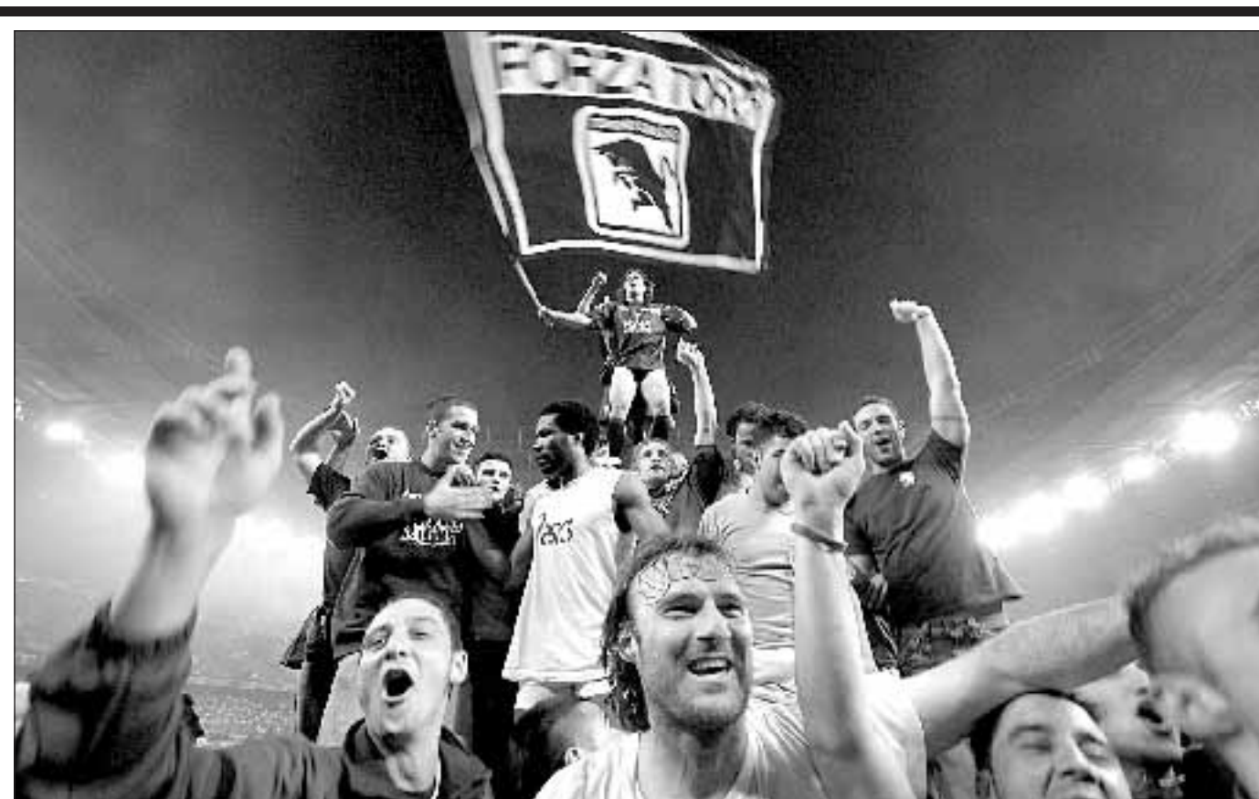
Tifosi e giocatori festeggiano il ritorno in serie A del Torino.

Ascoltato anche l'arbitro Paparesta. L'inchiesta chiusa entro la fine della settimana