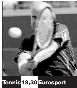
Tennis 13,30 Eurosport

L'ex capitano del Manchester Utd Roy Keane si è ritirato dal calcio a causa dei continui infortuni. Keane, 35 anni, centrocampista irlandese, ha giocato nel Celtic nell'ultima stagione, dopo 12 anni nello United. Il calciatore ha deciso sulla base dei consigli medici