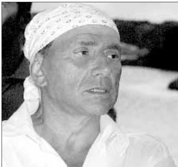
Silvio Berlusconi

Due giorni di festa a Marrakech tra balli in maschera, regali e pranzi di lusso per i 50 anni della moglie Veronica. Silvio Berlusconi ha organizzato, a sorpresa, un viaggio da sogno in onore della sua signora. Lo rivela il quotidiano marocchino «Aujourd'hui Le Maroc» in un articolo pubblicato in prima pagina dal titolo «Berlusconi corteggia sua moglie a Marrakech». Quarant'otto ore di follie d'amore. Con tanto di travestimento per l'ex premier. Tutto inizia martedì della scorsa settimana, scrive il giornale, quando la signora Berlusconi arriva con il figlio in città. La precedono sette amiche giunte in jet privato con fotografo e guardie del corpo al seguito. Appena atterrata, un accompagnatore locale la conduce sulla terrazza riservata del «Café de France» a Dar Soltana. Mentre sorseggia un tè verde alla menta la consorte del leader della Cdl non si accorge che in un angolo ci sono sette donne velate, vestite con abiti tradizionali berberi. Viene avvicinata. Dopo un po', però, le velate cominciano ad interessarsi un po' troppo da vicino alla signora italiana che, infastidita, chiede di essere lasciata in pace.