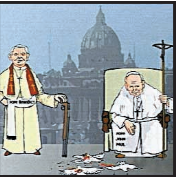
Tre fermo immagine delle vignette animate pubblicate sul sito Internet della televisione satellitare del Qatar al Jazeera.