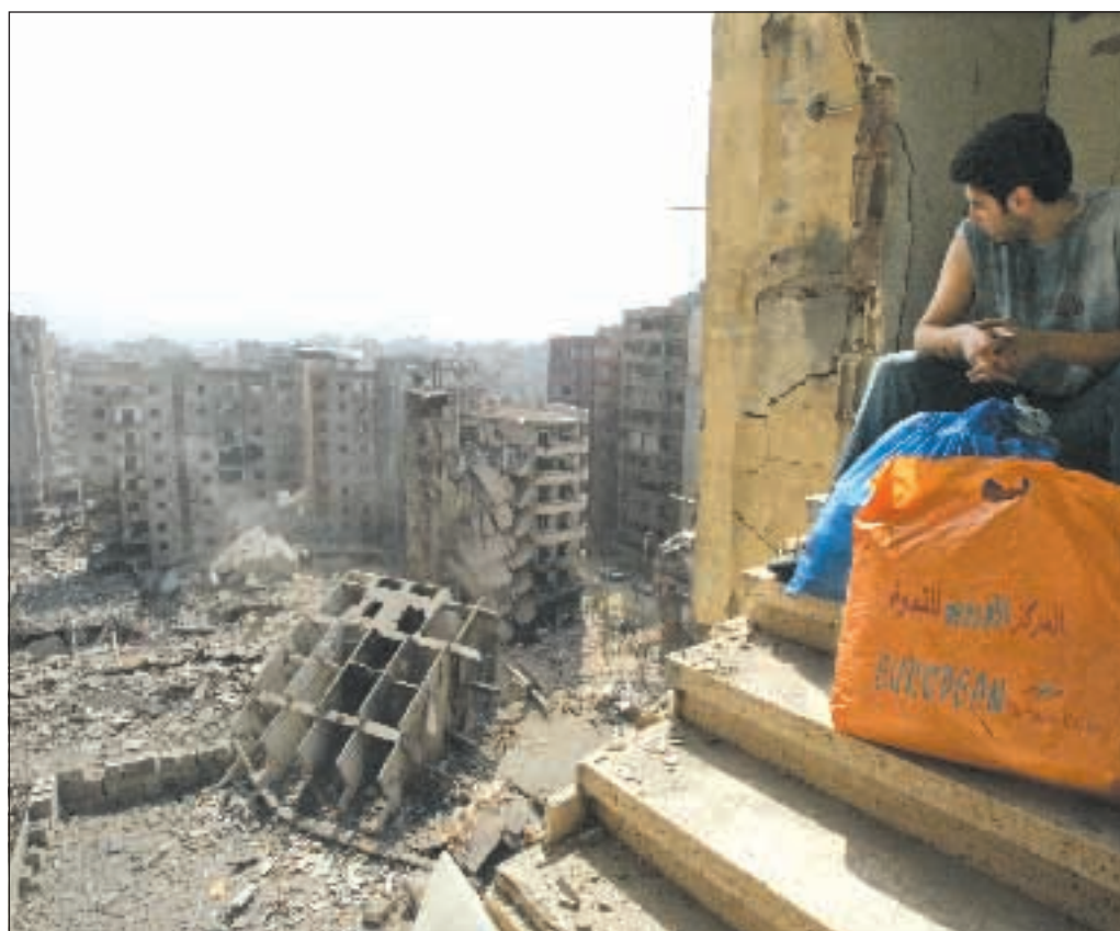
Un uomo guarda dall'alto le rovine di Beirut sud dopo i bombardamenti dei giorni scorsi.