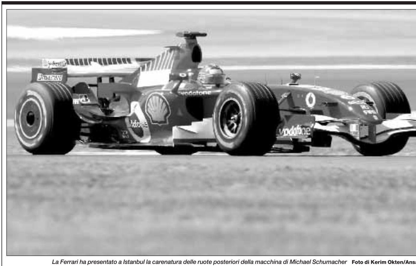
La Ferrari ha presentato a Istanbul la carenatura delle ruote posteriori della macchina di Michael Schumacher.

tato dall'atteggiamento della Juventus, che all'inizio aveva gestito con grande serietà la vicenda. Il ricorso al Tar non è una scelta opportuna». Del Piero però la difende: «Era un passaggio obbligatorio per la disparità di giudizio che c'è stata: la Juventus è stata l'unica a voltare pagina». Intanto Luciano Moggi lancia nuove accuse: «Il caso della Reggina (sanzionata con 15 punti in meno, ndr) dimostra che la Juventus ha subito un trattamento diverso rispetto agli altri club». L'ex dg bianconero ha attaccato anche l'ex presidente della Figc Carraro («Era lui a dare il cattivo esempio») e quello del Coni Petrucchi («Ha gravi responsabilità»), definendo «ridicola» l'assegnazione dello scudetto all'Inter.