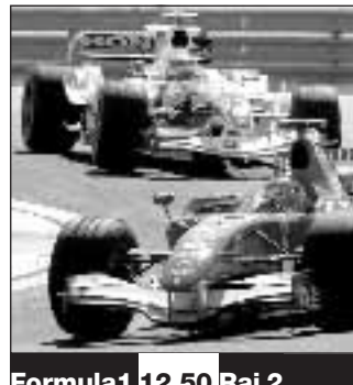
Formula 1 12,50 Rai 2

Senti chi parla... Finanziariamente indipendenti è l'obiettivo «che tutte le squadre dovrebbero avere per non dipendere dal mecenate». È l'idea di Berlusconi al convegno di Cl. «Io, con Galliani, da tempo punto a una parità di bilancio e quest'anno ci stiamo riuscendo»