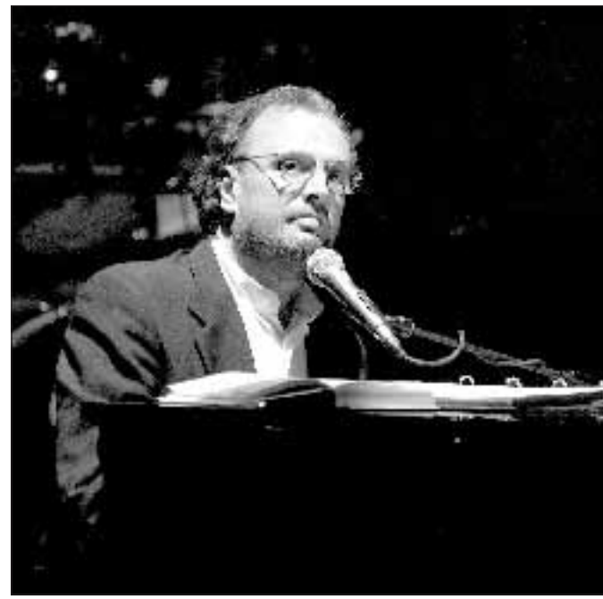
Fossati canterà a Villa Borghese l'8 settembre.