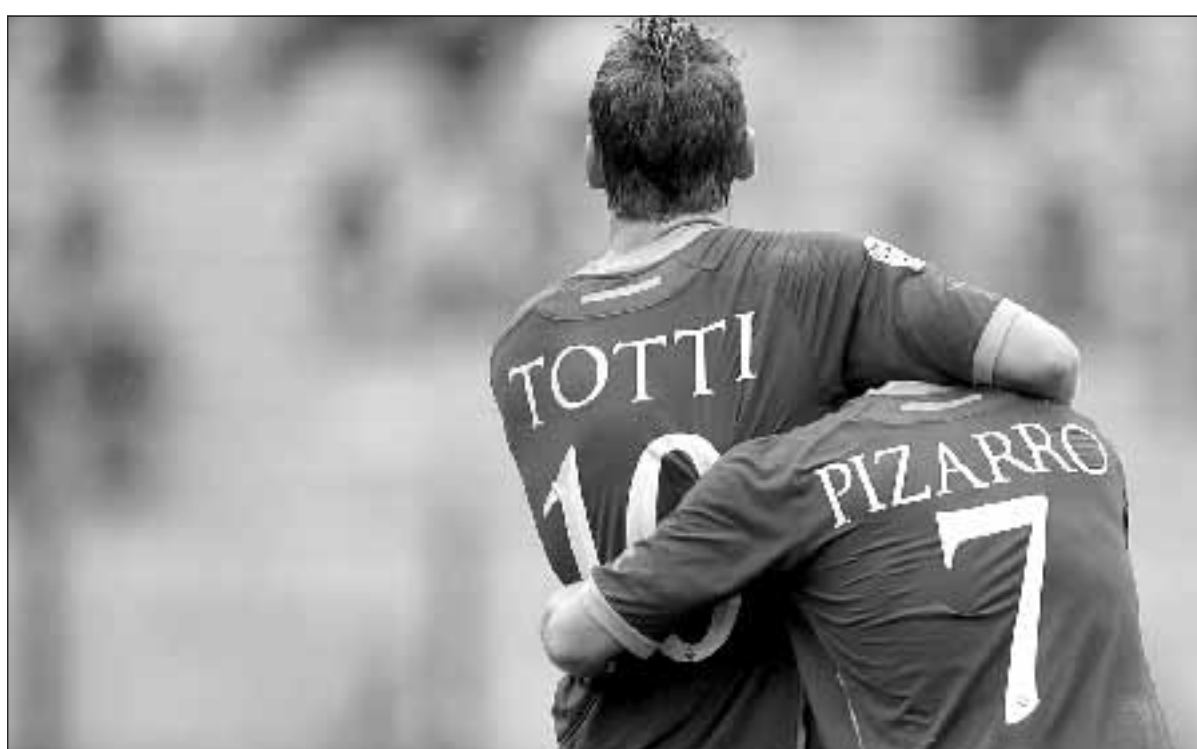
Un'immagine del trionfo giallorosso: David Pizarro abbracciato dal capitano Francesco Totti.