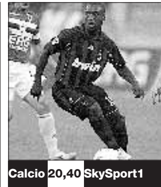
Calcio 20,40 SkySport1