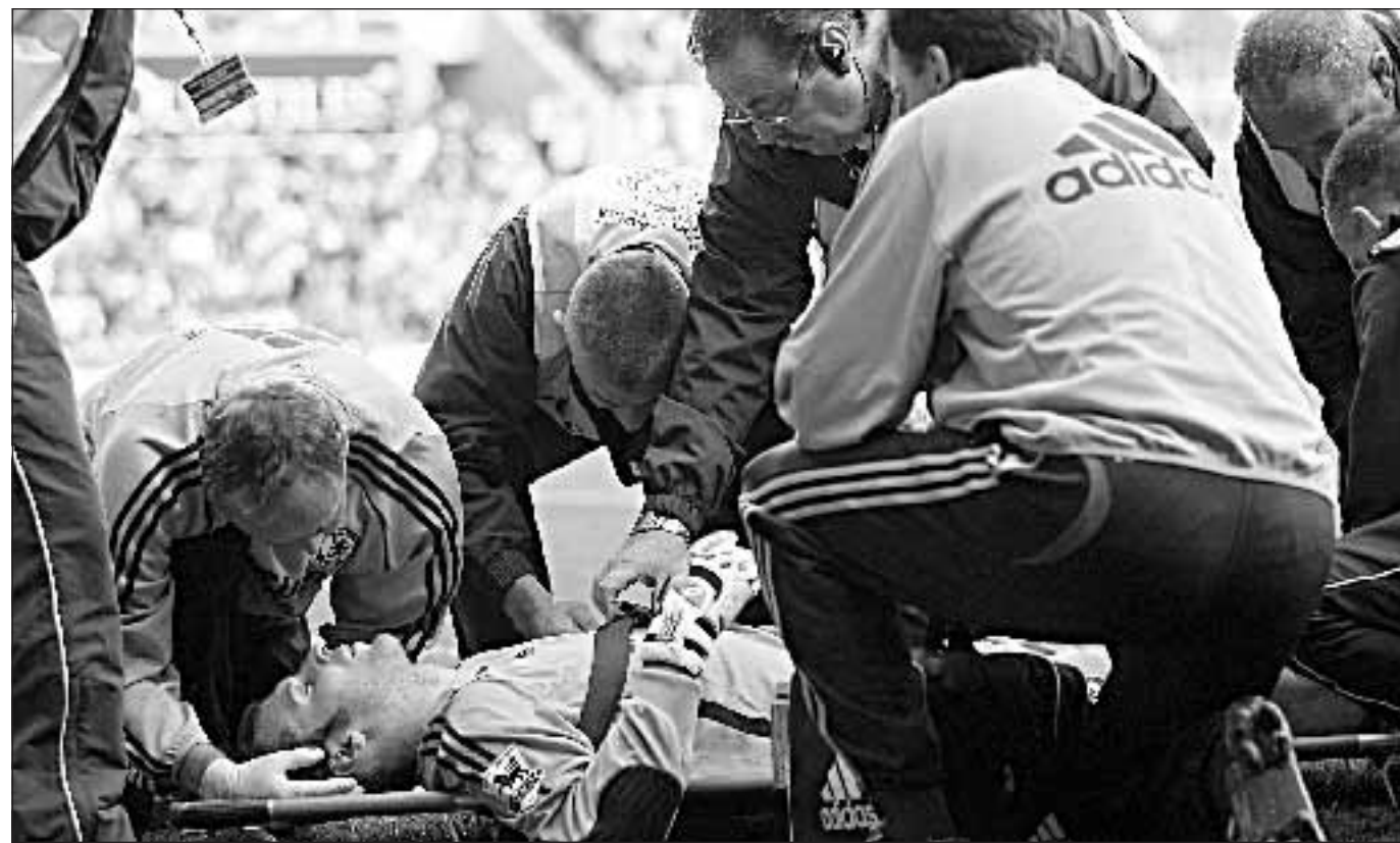
I primi soccorsi del personale medico del Chelsea a Petr Cech