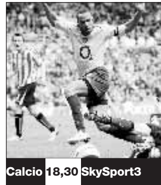
Calcio 18,30 SkySport3

Lutto nel mondo dello sport italiano. È morta a L'Aquila, Ondina Valla, la prima italiana a vincere un oro alle Olimpiadi. La Valla, che aveva 90 anni, trionfò negli 80 m. ostacoli a Berlino nel '36. In carriera, inoltre, 21 record nazionali e 16 presenze azzurre