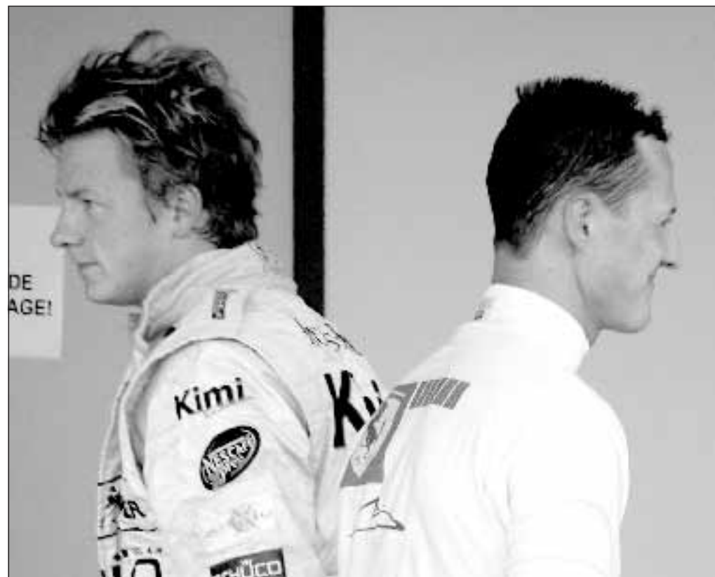
Michael Schumacher e Kimi Raikkonen, il vecchio e il nuovo della Ferrari