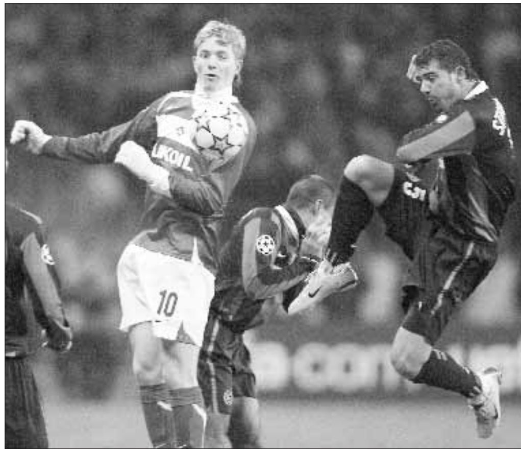
L'interista Dejan Stankovic in azione nell'area dello Spartak

Nel prossimo turno (22-novembre) l'Inter incontra in casa lo Sporting Lisbona; la Roma lo Shakhtar Donetsk in Ucraina.