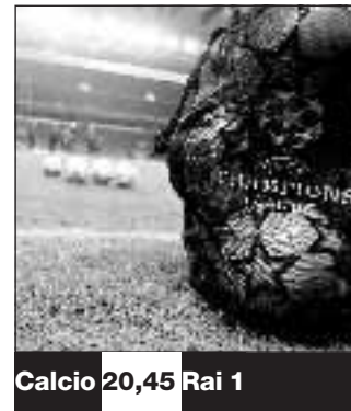
Calcio 20,45 Rai 1