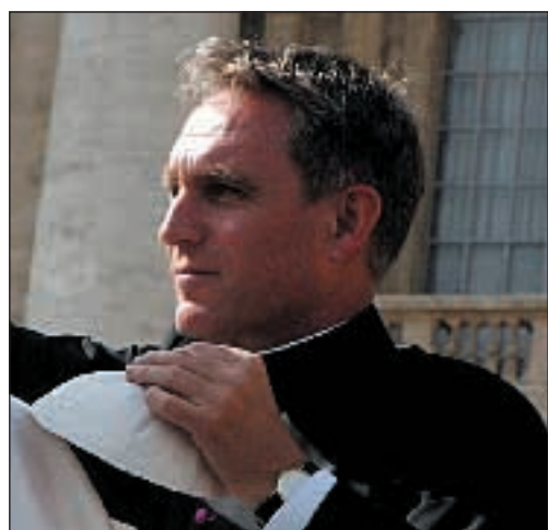
Monsignor Georg Gaenswein