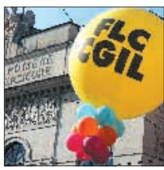
La scuola in piazza Foto Ansa