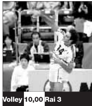
Volley 10,00 Rai 3

La Scozia ha ricevuto un richiamo dall'Uefa per l'eccessiva lentezza con la quale i suoi raccattapalle rimettevano in campo la palla nella gara di qualificazione agli europei vinta contro la Francia a Glasgow per 1 a 0: il ct dei galletti, Domenech, si era lamentato per i ritardi con cui veniva restituito il pallone