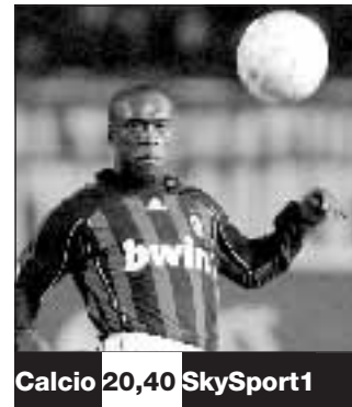
Calcio 20,40 SkySport1