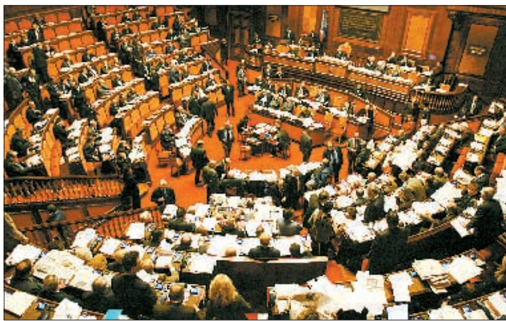
L'aula del Senato

al 15%. Un favore ai salotti buoni, dichiara Giuseppe Vegas (Fl). È politica per la casa, ribattono dalla maggioranza.