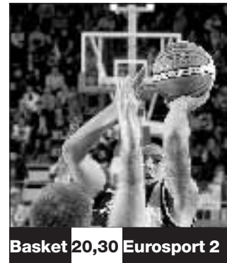
Basket 20,30 Eurosport 2