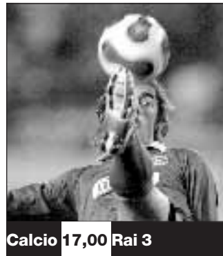
Calcio 17,00 Rai 3

Polemiche in Germania per un'intervista rilasciata da Paolo Di Canio al magazine «Four Four Two». L'ex giocatore della Lazio ora alla Cisco Roma, avrebbe difeso le sue idee sul fascismo e sul saluto romano che lo portò alla squalifica. La lega calcio tedesca ha protestato