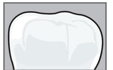
Le microparticelle bioattive (MICROREPAIR®) riparano lo smalto.