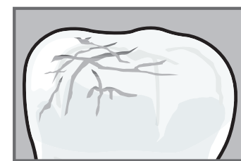
Il dente presenta microfratture e graffi non visibili a occhio nudo.

Essi appaiono subito più sani, bianchi e luminosi e viene ripristinata la naturale barriera contro ipersensibilità, placca, tartaro e carie.