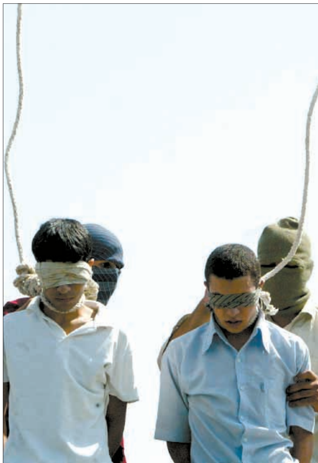
De Giovannangeli Fontana pag. 8-9