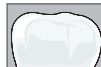
Le microparticelle bioattive (MICROREPAIR®) riparano lo smalto.