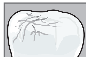
Il dente presenta microfratture e graffi non visibili a occhio nudo.

Essi appaiono subito più sani, bianchi e luminosi e viene ripristinata la naturale barriera contro ipersensibilità, placca, tartaro e carie.