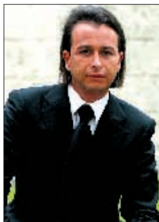
Camuso e R. Rossi a pag. 9

Sul rifinanziamento della missione militare in Afghanistan il governo non potrà la fiducia. Ci sono - secondo la Farnesina - tutte le condizioni per rafforzare il consenso all'interno del centrosinistra. Alla cooperazione civile verranno stanziati 10 milioni di euro aggiuntivi. Ma si punta ad un «voto quasi unanime del Parlamento», anche perché a differenza dell'Iraq, in Afghanistan c'è «oggettiva continuità» nell'azione dell'Italia.