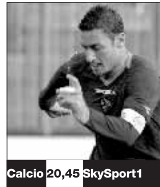
Calcio 20,45 SkySport1