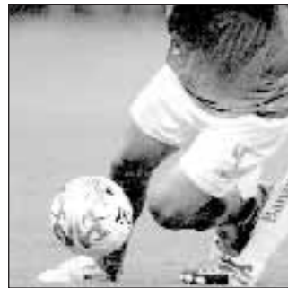
Calcio 15,00 SkySport1

Quando la sua squadra perde, Barton va fuori di testa. Dopo tanti problemi disciplinari, domenica il giocatore del Manchester City, è tornato a infiammare gli spalti: si è tirato giù le mutande e ha mostrato il sedere agli spettatori del Blackburn che festeggiavano la vittoria