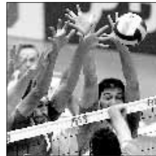
Volley 20,30 SkySport2