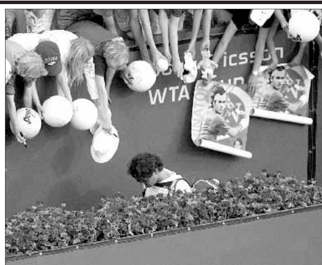
Fans salutano Roger Federer dopo la sconfitta contro l'argentino Guillermo Canas.

Una querelle che accoglie anche l'opinione di chi la partita l'ha giocata: «Mutu? Di certo il suo non è stato un bel gesto - spiega il rosanero Biava -, ma il regolamento gli dà ragione». E, regolamento alla mano, l'Aic (Associazione Italiana Calciatori) ripropone la circolare sul fair play del presidente Sergio Campana in occasione dell'ultima riunione tra arbitri, calciatori e allenatori del 15 gennaio scorso. In quell'occasione lo stesso Campana aveva spiegato che «qualora un calciatore resti a terra per infortunio più o meno grave, debba essere solo l'arbitro a decidere l'interruzione del gioco. E ciò per evitare quanto sta ora succedendo sui campi di gioco: opportunismi, polemiche, discussioni di ogni tipo. Quindi d'ora in poi (e in attesa - si sottolinea - che nel calcio italiano possa affermarsi il vero «fair play») in caso di infortunio di un calciatore, né gli avversari, né i compagni di squadra sono tenuti a calciare fuori campo il pallone. E se ciò eventualmente accadesse, chi rimette il pallone in gioco non è tenuto a restituirlo agli avversari». Esattamente quello che Capello aveva chiesto tempo fa contro le continue interruzioni del gioco per calciatori a terra: allora, la richiesta del tecnico del Real Madrid, era di evitare le simulazioni.