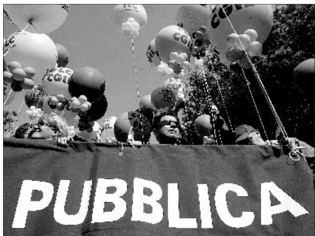
Un corteo di dipendenti pubblici a Roma in una foto d'archivio.