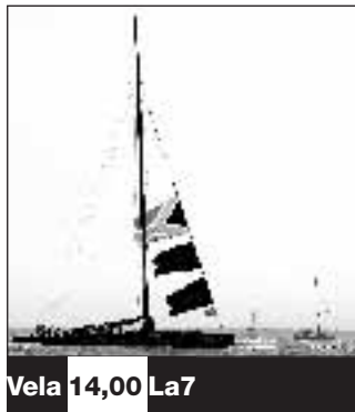
Vela 14,00 La7

L'ex centrocampista del Brescia, Marcus Schopp, passato al Salisburgo (serie A austriaca), è stato messo fuori rosa dalla gestione tecnica Trapattoni-Matthaeus. Per tutta risposta lui ha portato la società in tribunale: che gli ha dato ragione