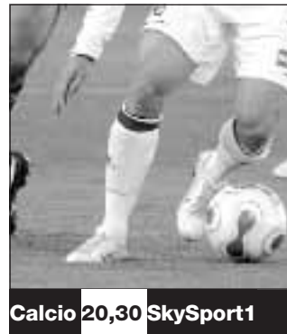
Calcio 20,30 SkySport1