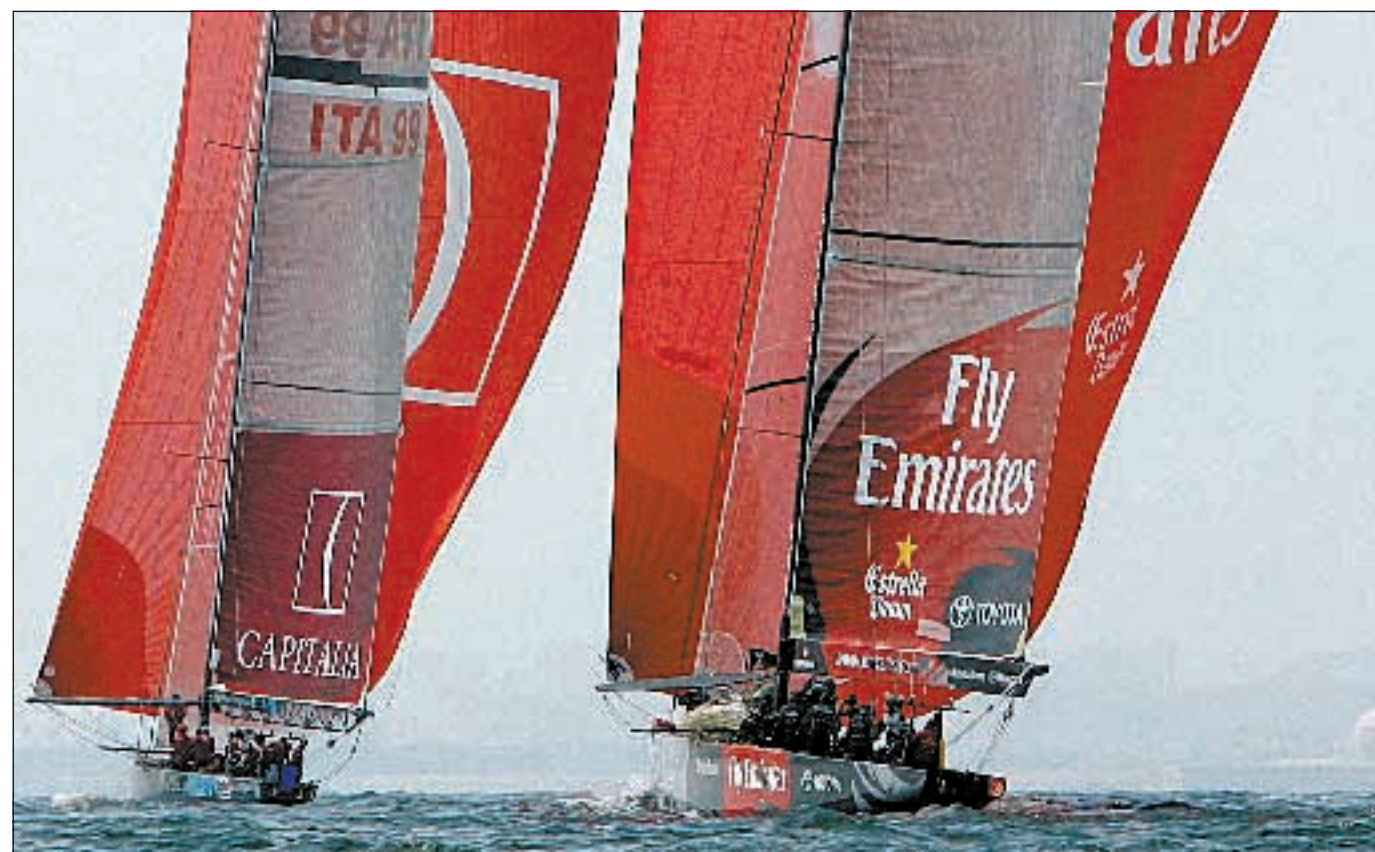
Mascalzone Latino vittorioso all'esordio contro i favoriti di New Zealand.

che, nonostante una penalità subita nel pre-partenza, hanno vinto facilmente (+2'45"). La terza imbarcazione italiana ha insomma evidenziato forti limiti, acuiti dalla sfortuna (ha perso un albero prima delle gare, senza riuscire a rimontarlo). Per l'Italia un'altra piccola soddisfazione è però arrivata da Shosholoza, barca africana ma guidata da un comandante italiano, che ieri ha battuto l'United Internet Team Germany, regalando all'Africa il suo primo successo nella Louis Vuitton. Oggi pomeriggio si riparte, vento permettendo. Mascalzone Latino se la vedrà con Desafio, mentre +39 dovrà subire la rabbia agonistica di Emirates. Impegni alla portata invece per Luna Rossa contro il Team Germany e Shosholoza.