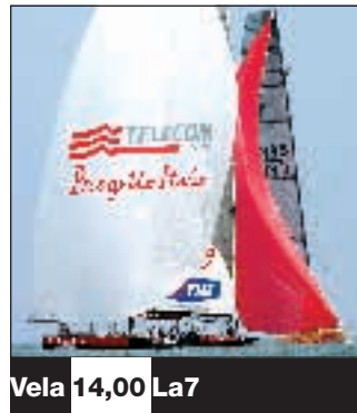
Vela 14,00 La7

Dopo la bocciatura dell'Italia per gli Europei del 2012, Franco Carraro si dimetterà da membro del Comitato Esecutivo Uefa. Lo rivela il presidente della Federcalcio, Abete: «Ho sentito Carraro in questi giorni - ha detto - e si è reso disponibile a rimettere il mandato»