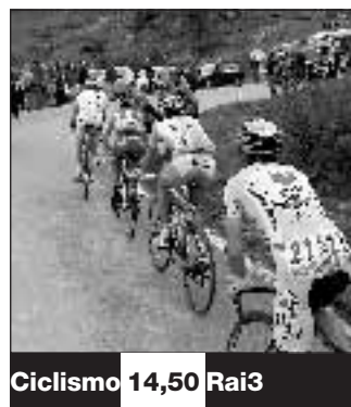
Ciclismo 14,50 Rai3