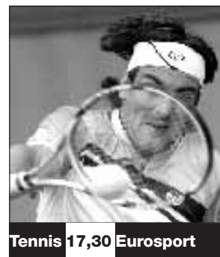
Tennis 17,30 Eurosport