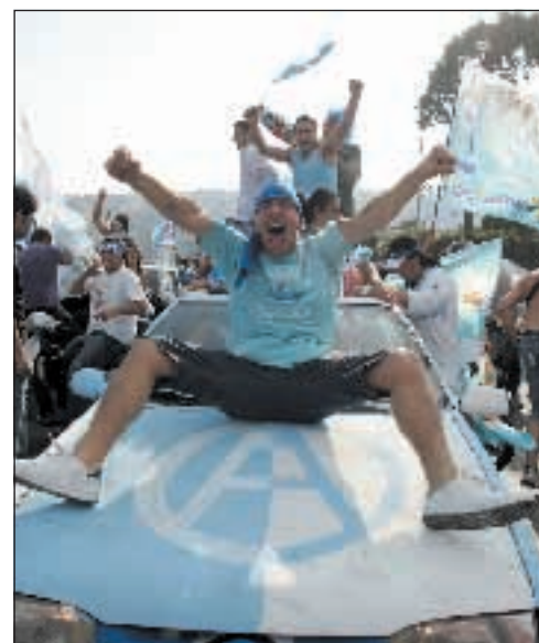
Amato e Basile alle pagine 12-13