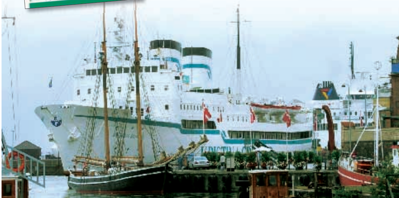
La M/n KRISTINA REGINA, una nave tradizionale per un itinerario insolito.

Varata in Svezia nel 1960, ristrutturata e rimodernata nel 2001, è oggi dotata delle più alte tecnologie per la navigazione e di ogni comfort per la vita di bordo: spazio fitness, sauna, lavanderia; i due bar: Manoeuvre e Panorama (quest'ultimo è anche biblioteca di bordo), sono accoglienti spazi resi ancora più caldi da arredi in legno nel più autentico stile marinaro. Anche le cabine, come gli spazi comuni, sono perfettamente in armonia con l'atmosfera unica di questa nave di stile tradizionale a due ciminiere, che sembra rievocare "i bei tempi passati".