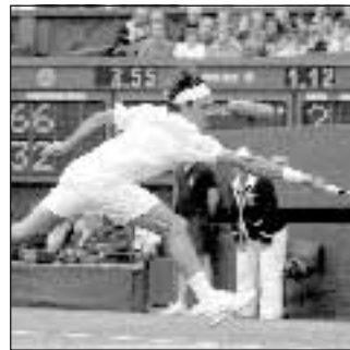
Tennis 13,00 Sky Sport 3

È polemica fra Australia e Sudafrica per la decisione di Johannesburg di inviare una nazionale imbottita di riserve per le due partite del Tri Nations: i dirigenti degli Springbocks e il ct White hanno deciso così di risparmiare titolari, il presidente "aussie" li accusa «di aver mancato la parola data»