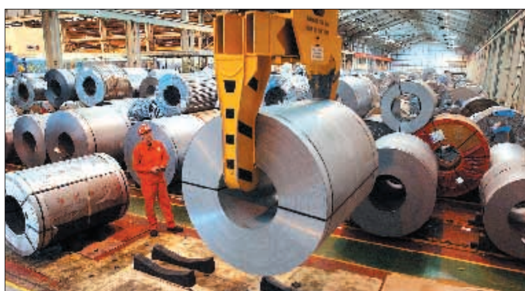
L'interno di un'acciaieria.

In Europa, invece, gli affari procedono bene.