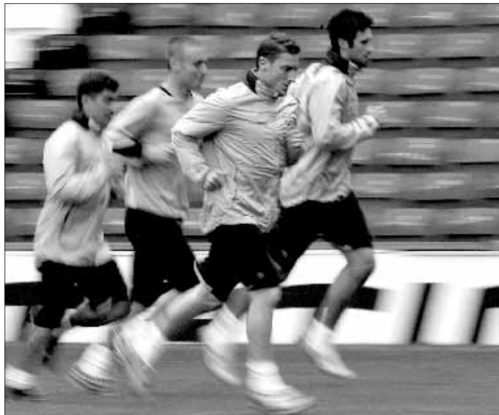
Già cominciati i primi allenamenti per i giocatori della serie A

cate a ritmi bassi, con squadre incomplete e con i muscoli imballati, preziose per le televisioni, perché portano grandi ascolti e sponsor. Ossia denaro: linfa vitale per il calcio che non si ferma mai.