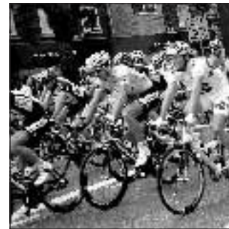
Ciclismo 15,30 Rai3