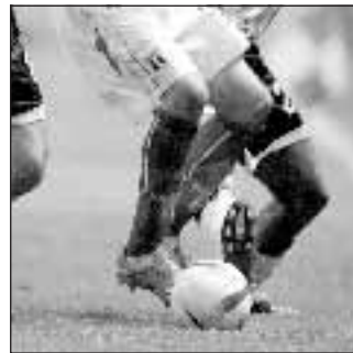
Calcio 10,00 Sportitalia

Il Siena chiederà alla Federcalcio l'autorizzazione a modificare la denominazione sociale inserendo il nome del proprio sponsor. Si passerebbe così da «Ac Siena spa» a «Ac Siena Montepaschi spa». L'ha deliberato l'assemblea straordinaria del club che ha deciso la variazione dell'art. 1 dello statuto. La banca toscana è sponsor del Siena dal 2000