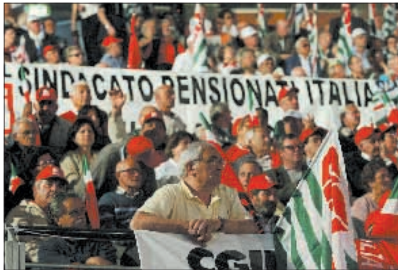
La manifestazione dei pensionati di Cgil, Cisl e Uil, a Roma.

Sono davvero contento dell'accordo sulle pensioni. Ora si può dire con certezza che ci sono governi più sensibili di altri per i pensionati e lavoratori. Ora Prodi deve completare l'opera, de-