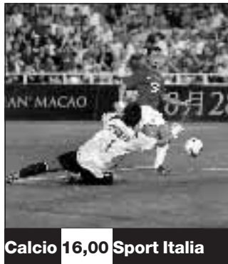
Calcio 16,00 Sport Italia