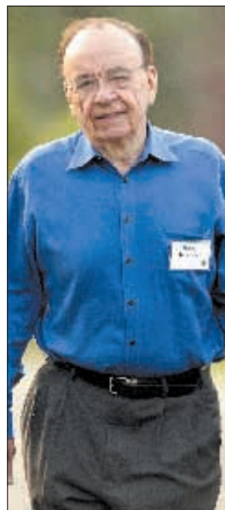
Rupert Murdoch

(l'una del mattino in Italia) rifiutandosi di anticipare la loro intenzione di voto. Questo dopo aver già ignorato la scadenza di lunedì per dare una risposta al magnate australiano, che irritato aveva fatto sapere d'essere pronto a rinunciare all'affare. Gli indecisi hanno perso all'improvviso forza contrattuale quando Murdoch si è reso conto di avere dalla sua parte almeno metà della famiglia, un pacchetto pari al 32% della società. Un altro 30% è assicurato dagli azionisti che non appartengono alla famiglia Bancroft e che sono stati sin dall'inizio a favore dell'operazione. Per lunghi mesi si è parlato di un braccio di ferro per difendere il prestigio e l'indipendenza della testata in edicola dall'8 luglio 1889 e che è considerata un pezzo di storia americana. Murdoch negli Stati Uniti vuol dire Fox e New York Post, informazione spazzatura. Al punto che i candidati democratici si sono ri-