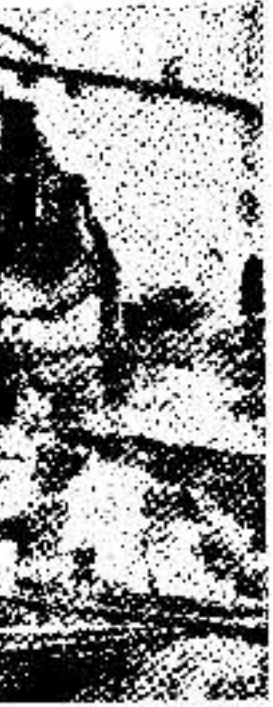
Una serie di immagini che illustrano lo scoppio e la disgregazione del bacino di sbarramento di Vajont

In tutto il paese per la sciagura del Vajont