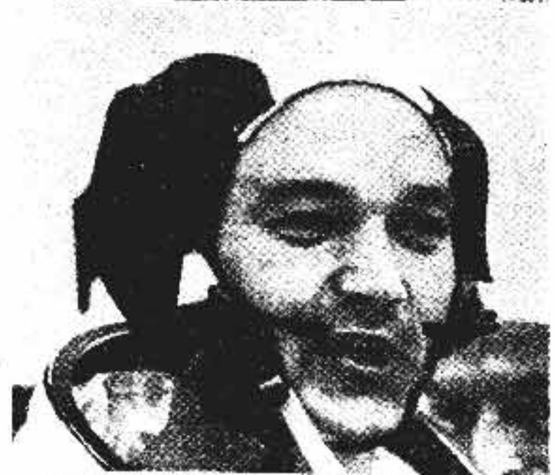
Foto della Luna dal filo in basso: Neil Armstrong, Edwin P. Aldrin jr. e Michael Collins.