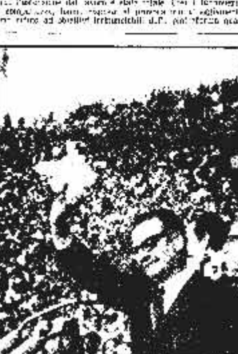
Allende parla a Santiago a 800 mila lavoratori: «Sconfiggeremo il fascismo»

H. 20 FERMATI GENERALI A TORINO PER IL LAVORO E CONTRO IL CAROVITA