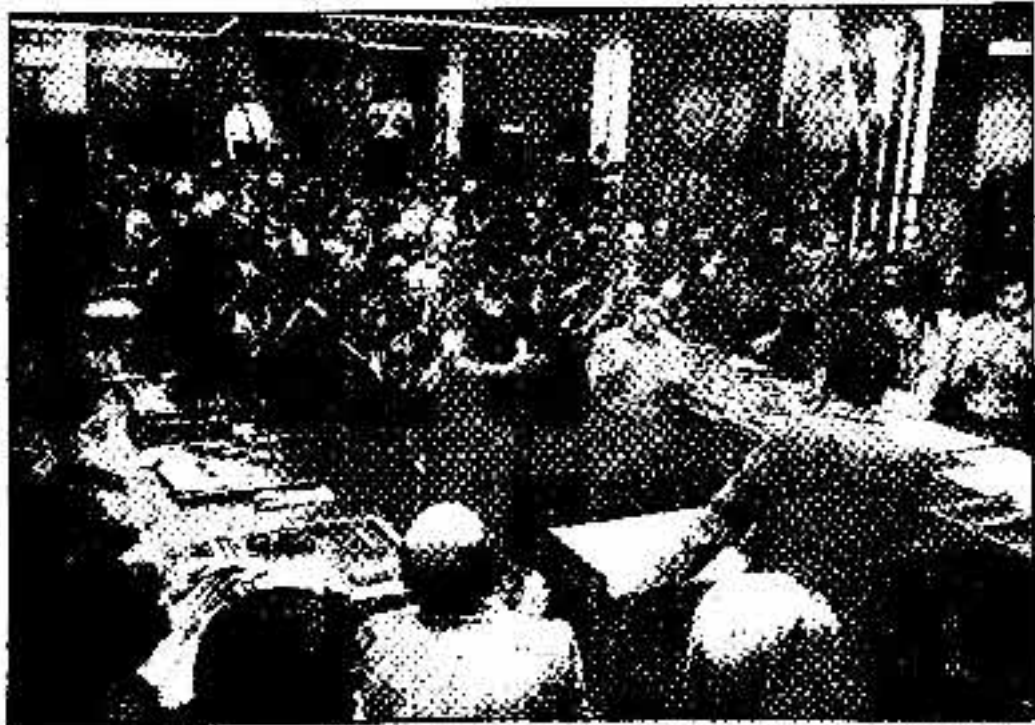
Il compagno Enrico Berlinguer, ex aetate, parla ai compagni riuniti, fotografi e giornalisti

Il compagno Enrico Berlinguer, ex aetate, parla ai compagni riuniti, fotografi e giornalisti. Berlinguer ha parlato con entusiasmo della vittoria del «no» e ha ringraziato il nostro giornale per il suo contributo.