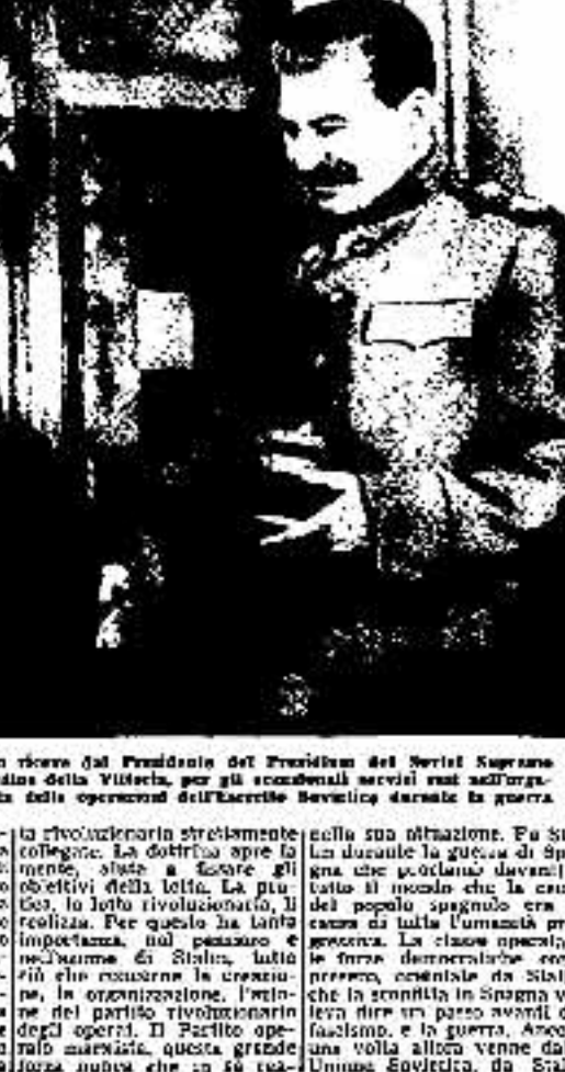
15 LUGLIO 1941 - Stalin viene dal Presidente del Soviet Supremo...