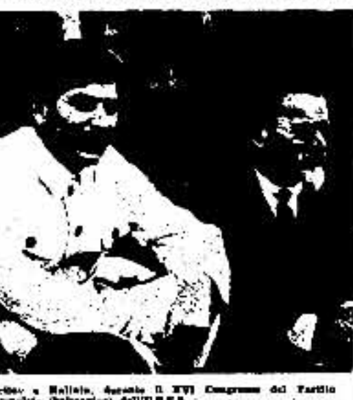
1939 - Stalin, con Voroshilov e Malin...