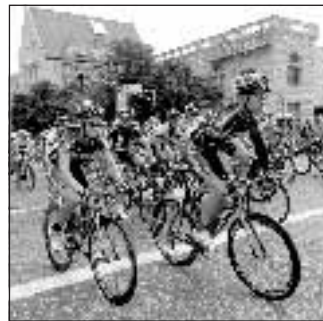
Ciclismo 16,00 Eurosport

Secondo il Daily Mirror Fernando Alonso, «reconfesso» nella spy story che ha vissuto il suo epilogo con la condanna ai danni della McLaren, avrebbe offerto ai suoi meccanici 650 sterline a testa (1000 euro) per ogni gara conclusa davanti al compagno di scuderia Lewis Hamilton