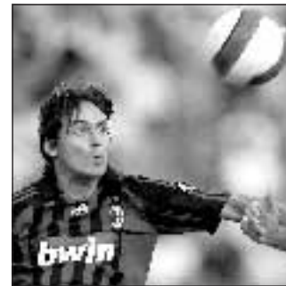
Calcio 20,45 SkySport1