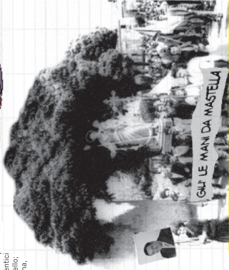
Ceppaloni. L'imponente manifestazione guidata dai monaci carmelitani per la liberazione di Mastella e il ritorno alla democrazia.

MASDELLA RAFFRESCA GLI ELETTORI CATTOLICI?