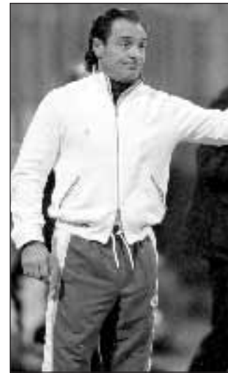
Cesare Prandelli.

PRIMA VOLTA Fischi all'annuncio del posticipo e qualche coro («Assassini, assassini») indirizzato contro le forze dell'ordine, partito dal settore ospiti. Così i tifosi di Fiorentina e Udinese hanno vissuto la domenica allo stadio "Artemio Franchi". Prima sconfitta in campionato per la Fiorentina. I viola cedono 2-1 al «Franchi» contro una brillante Udinese. Al 6' subito ampi spazi per i viola: Semoli scambiava velocemente con Liverani e con un gran destro impegnava Handanovic. Due minuti dopo Mutu in rovesciata con palla di poco fuori. I viola erano più pimpanti in fase di costruzione del gioco, l'Udinese sembrava davvero in affanno, soprattutto in difesa. Al 23' friulani in vantaggio: millimetrico cross dalla destra di Inler