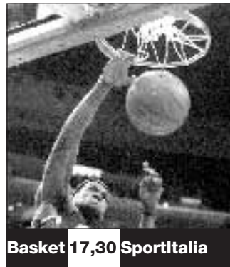
Basket 17,30 Sportitalia

«Per quanto ciò può sembrare strano noi sosteniamo l'Italia: un Europeo senza i campioni del mondo è difficile da immaginare» dice Henry. Se l'Italia dovesse vincere in Scozia, la Francia sarebbe infatti già qualificata ancor prima del match in Ucraina del 21 novembre