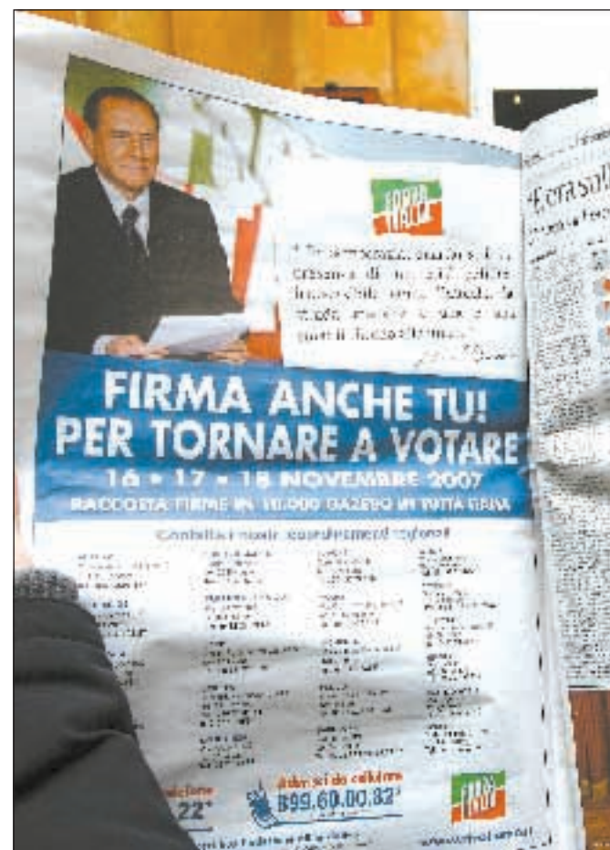
Una pubblicità dell'iniziativa di Forza Italia.

Accanto campeggiano due «aperte» pubblicitarie della Festa del Tevere organizzata da Giro contro il degrado. Son et lumieres oggi sul battello ormeggiato accanto a Castel Sant'An-