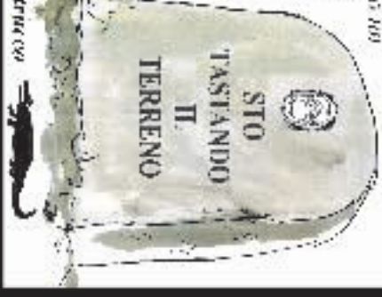
di Alberto Patricio