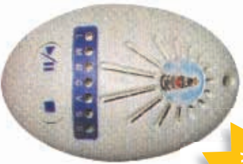
Per dirla Fonzie

Im-per-di-bille! Una vera tentazione. Il rosario digitale non è uno scherzo da preli. Si trova in diversi colori e in 16 diverse icone del bambinello di Prada alla vergine di Europa alla madonna dell'Auto.